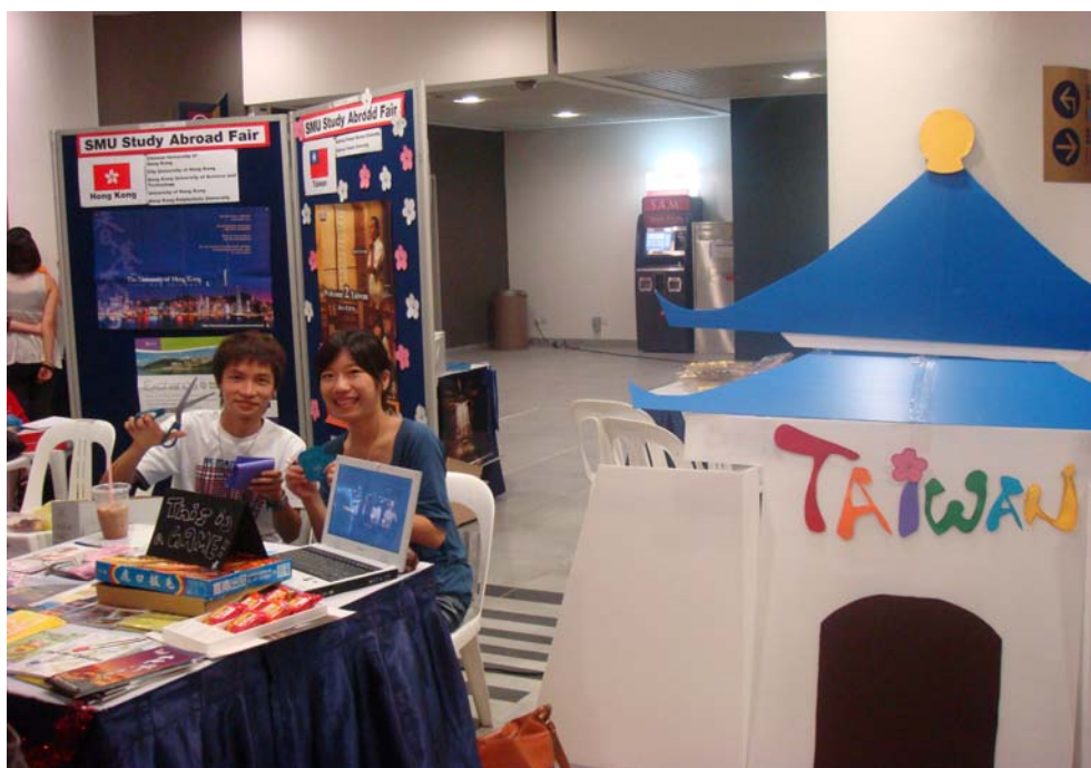
展場當天的台灣攤位。右邊是我們親手打造的立體版中正紀念堂！