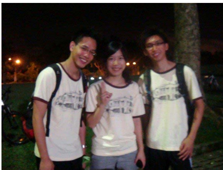
挑戰當地學生的夜騎馬拉松活動(Night Bicycling) 從晚上七點騎到隔天早上八點，全程共六十多公里。