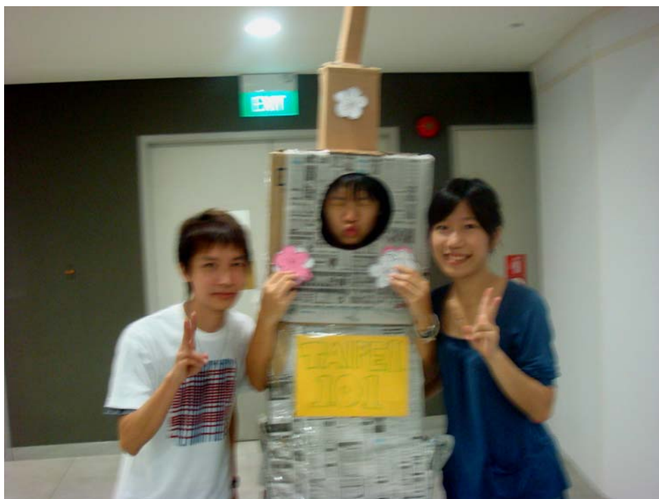
熬夜趕工的真人版『Taipei 101』服裝為攤位作動態宣傳。