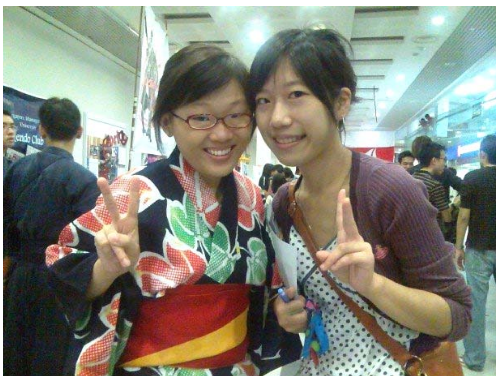
SMU CCA Day (社團展覽日) 與朋友在日本文化研究社前合影