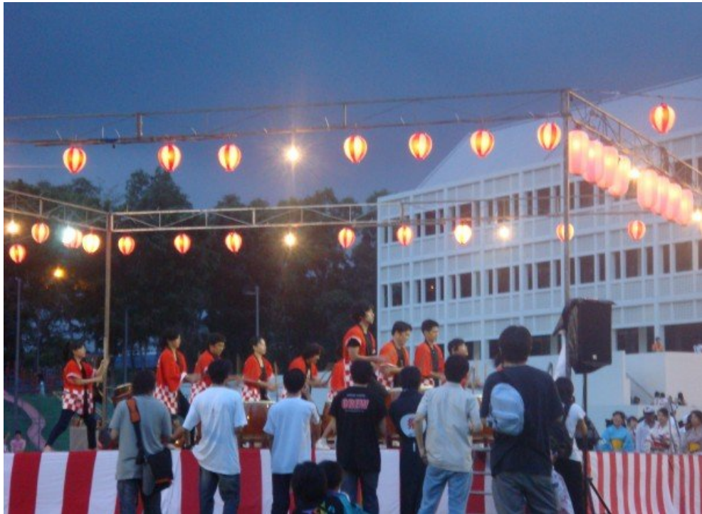
日本學校一年一度的夏日大祭，不論是新加坡人或日本人都會共襄盛舉的活動。