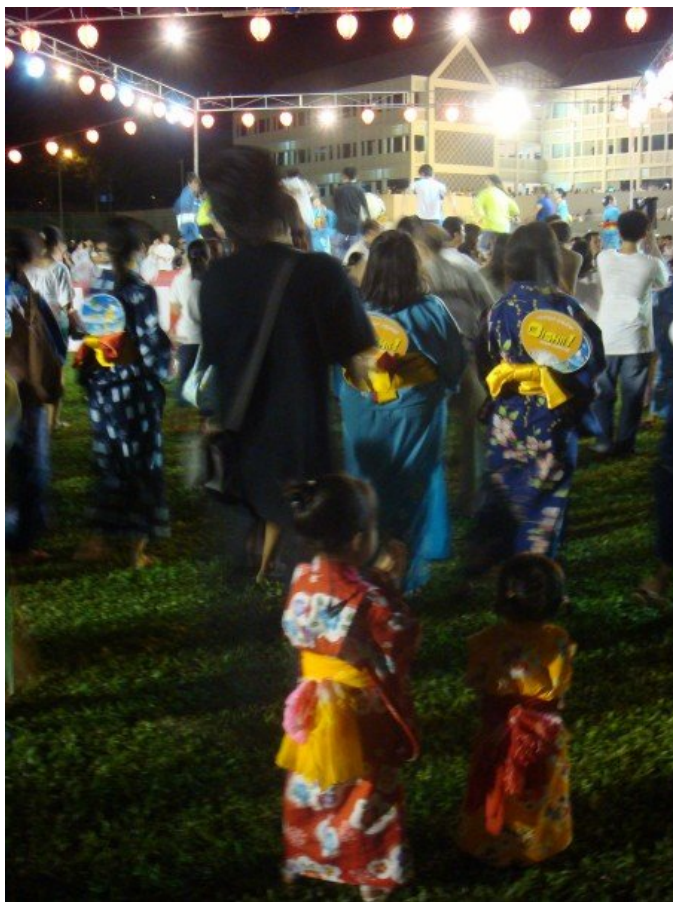
夏日大祭的會場上幾乎大家都穿著和服，顯示新加坡對外國文化的包容與接納。