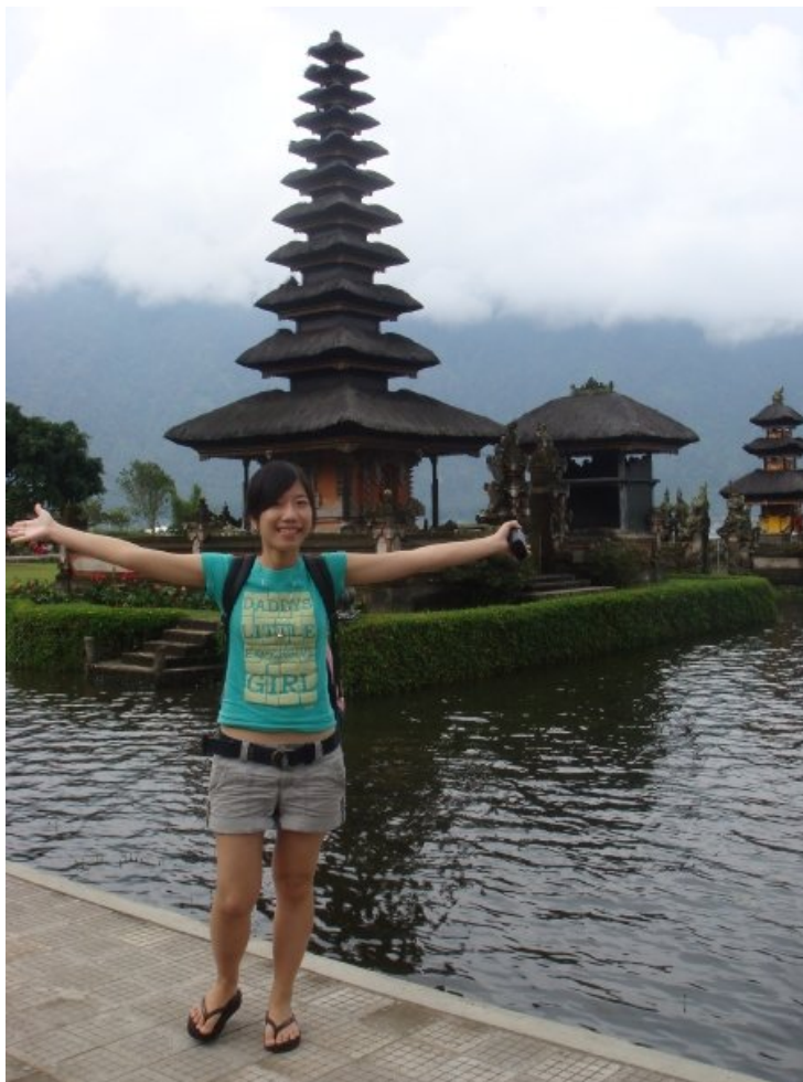
峇里島四日遊- 神秘的女神廟