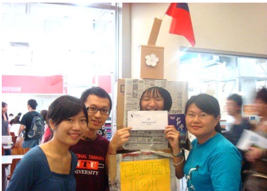
開心與獎品合照-為國爭光得到最佳攤位第一名!