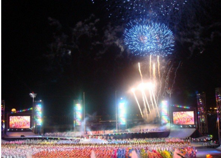
國慶日當天晚上持續十五分鐘以上的煙火秀表演