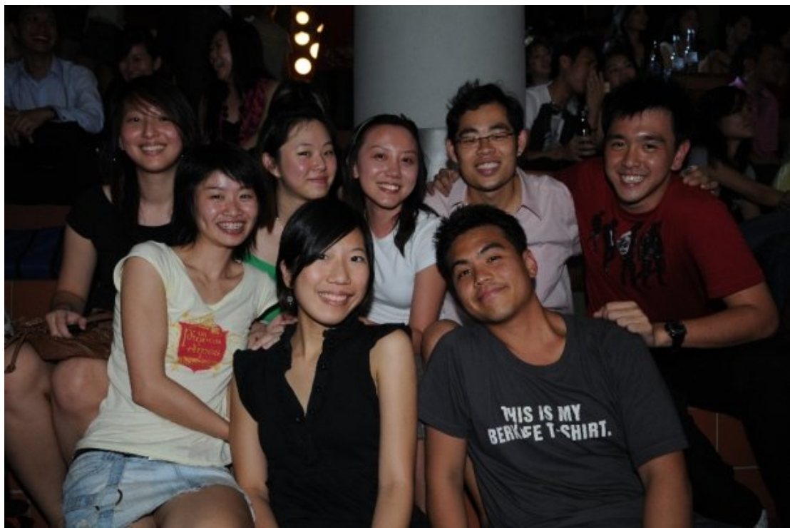
Starry Night- SMU 校園演唱會；與新加坡友人合影