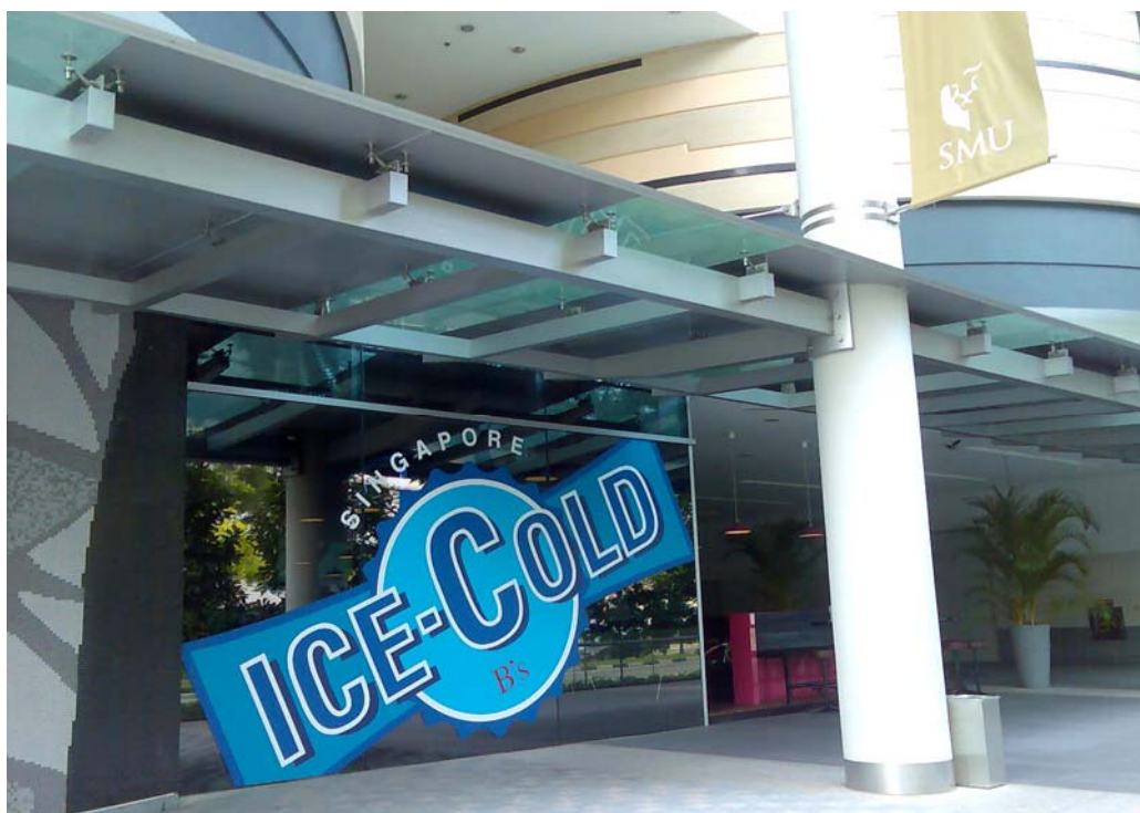
Lee Kong Chian School of Business 一樓還設有一間酒吧讓 SMU 學生連繫感情、放鬆身心。