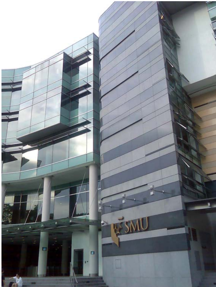
位於市中心的新加坡管理大學 Lee Kong Chian School of Business 大樓外觀。