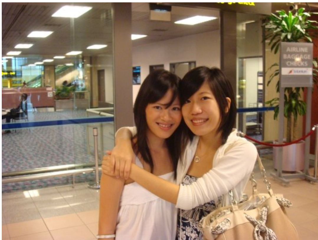
Bye Bye Singapore! - 樟宜機場好友送行