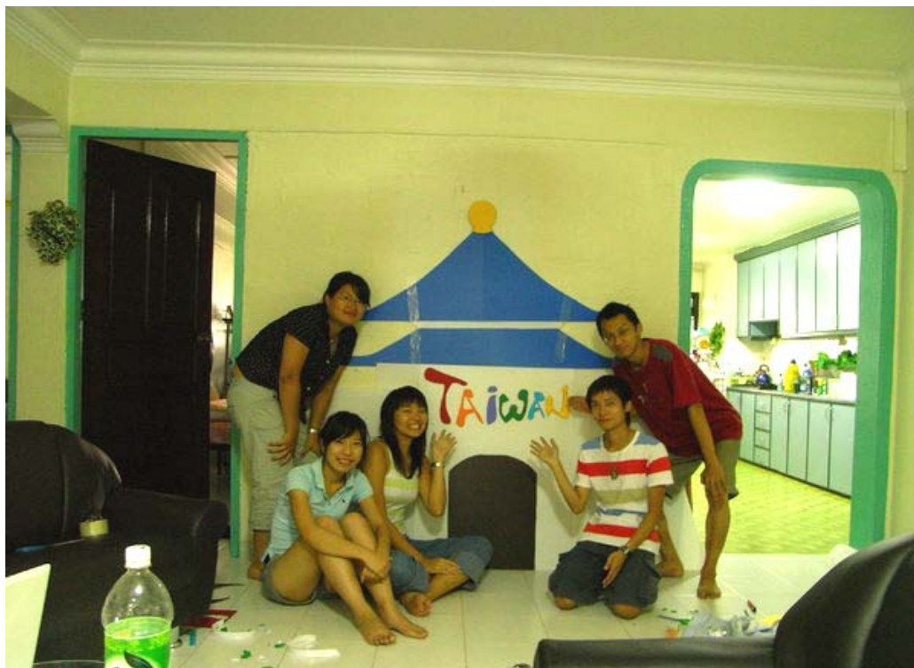
與其他四位台大交換學生共同準備 SMU 的 Study Abroad Fair