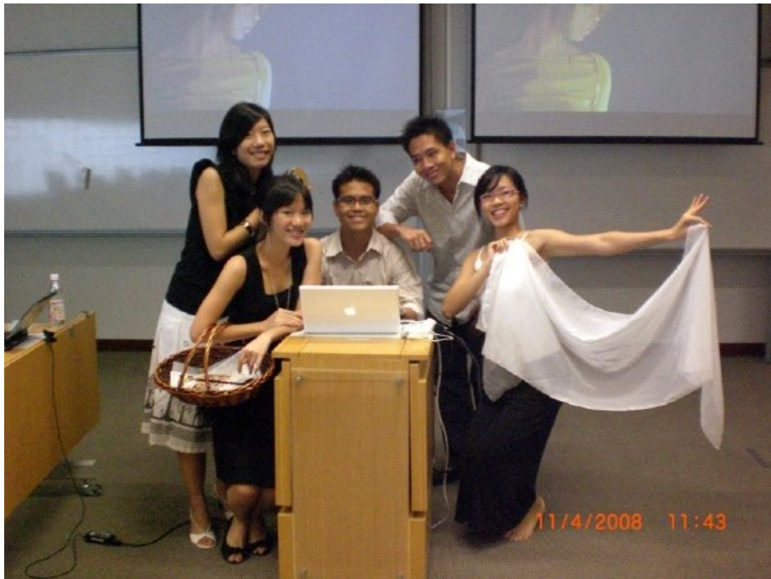
Advertising Final Project- 與同組的新加坡同學教室內合影