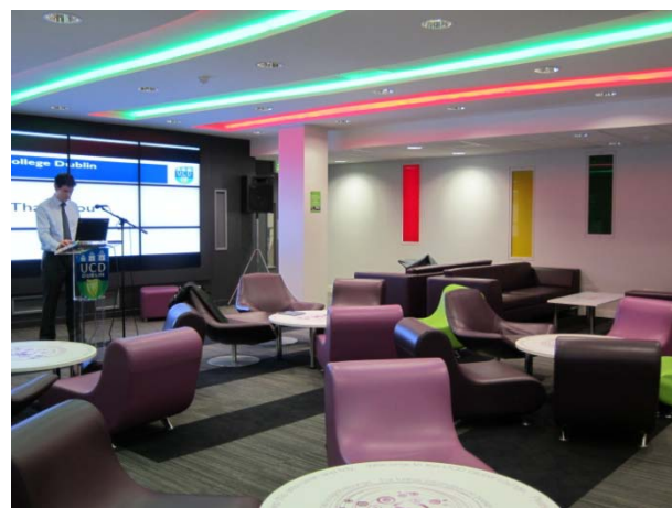
參訪都柏林大學 UCD – International Lounge