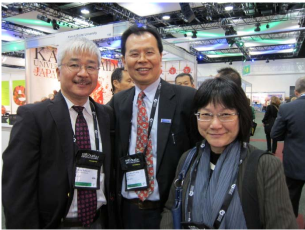
前現任國際長與日本姊妹校同志社大學代表