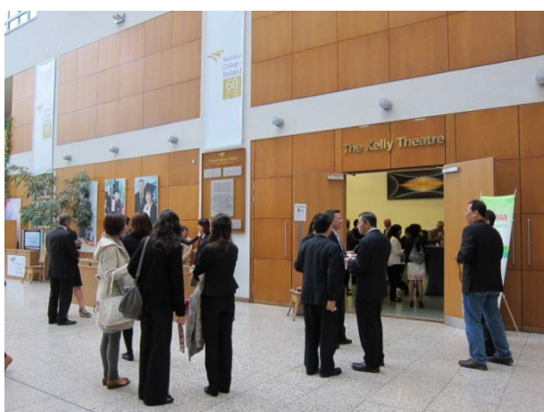
愛爾蘭辦事處交流晚宴