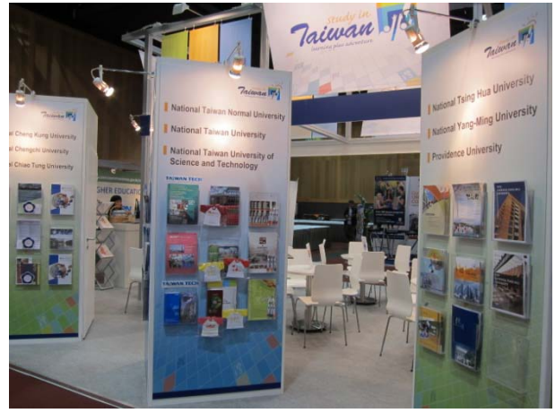
台灣攤位與文宣牆