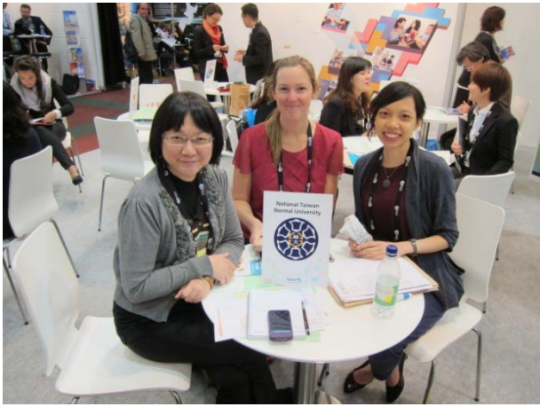
姊妹校荷蘭萊頓大學代表