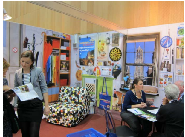
捷克代表團攤位佈置