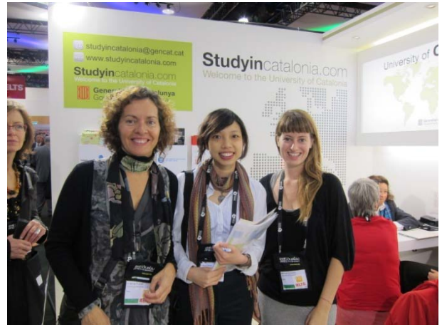
西班牙巴塞隆納大學代表