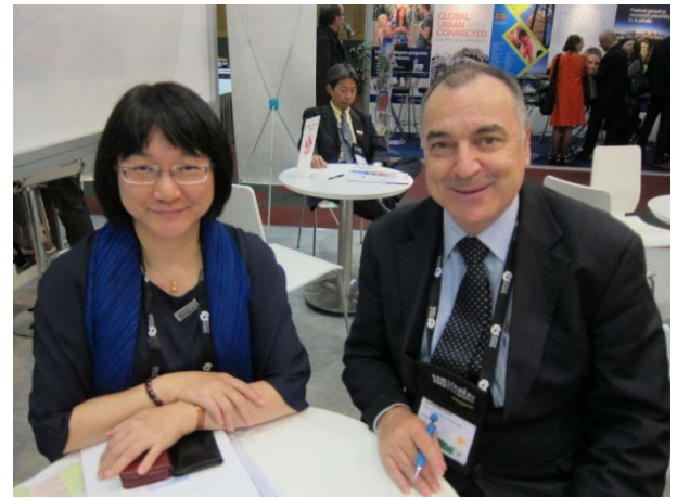
澳洲昆士蘭大學代表