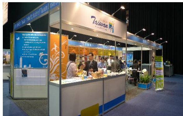
”Study in Taiwan” 攤位