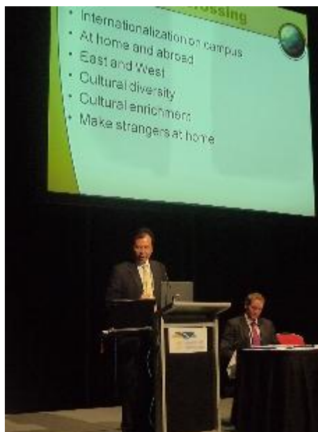
處長於Session中發表演講