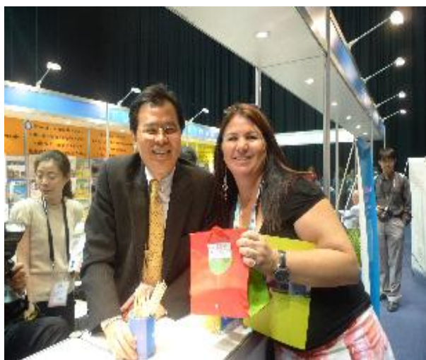
處長主持HAPPY HOUR與來賓合影