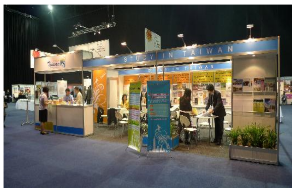
”Study in Taiwan” 攤位