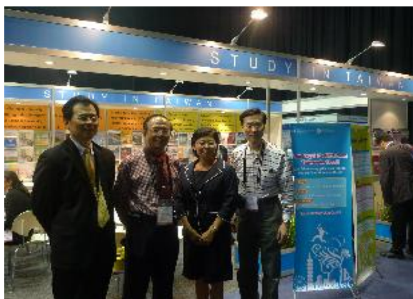
處長、林政務次長聰明、駐澳文化辦事處 遲組長合影