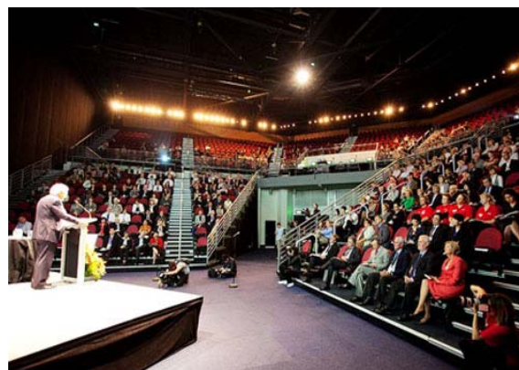
澳洲前總理Mr. Bob Hawke開幕演講