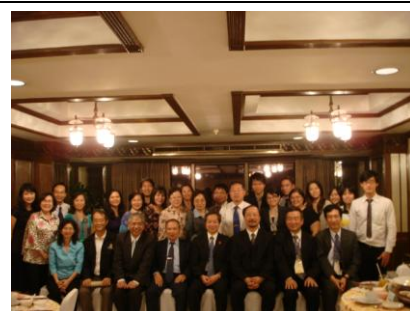
2/11 與師大泰國校友會餐敘後合影