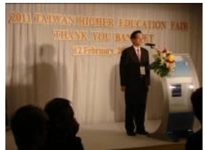
2/12 教育部晚宴：吳清基部長致詞