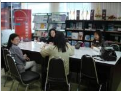
2/14 參訪清邁台灣教育中心 /清邁湄洲大學