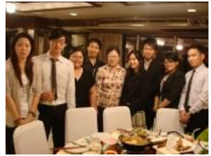
2/11 泰國師大校友合影