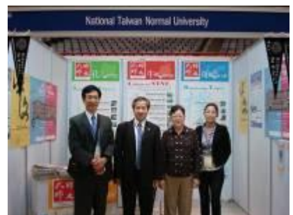
2/15 2011 台灣高等教育展：台師大攤位/清邁大學