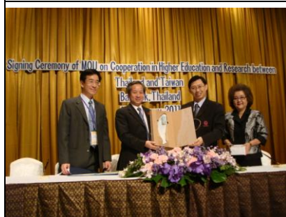
2/11 師大與泰國 Sripatum 大學簽約後致贈禮物