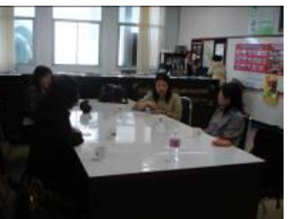
清邁台灣教育中心