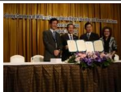
2/11 師大與泰國 Sripatum 大學簽訂合作協議（MOU）後合影