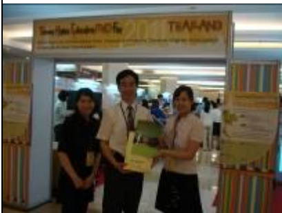
2/12 台中教育大學致贈曼谷台灣教育中心禮物