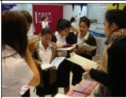
2/15 2011 台灣高等教育展