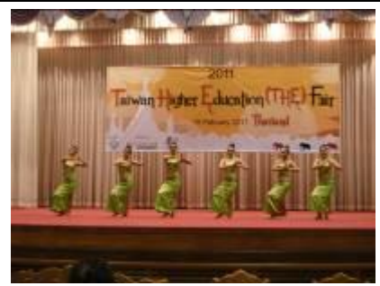
2/15 2011 台灣高等教育展：表演活動