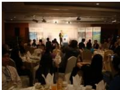
2/12 教育部晚宴 /曼谷香格里拉飯店