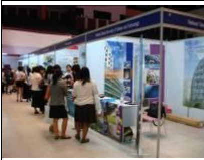
2/15 2011 台灣高等教育展/清邁大學