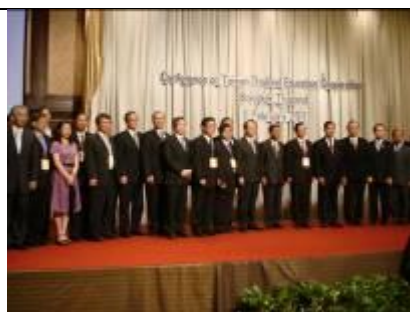
2/11 台泰教育論壇：雙邊校長合影