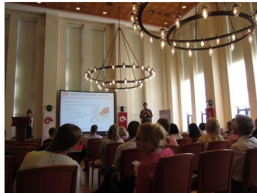
參訪 Koc University