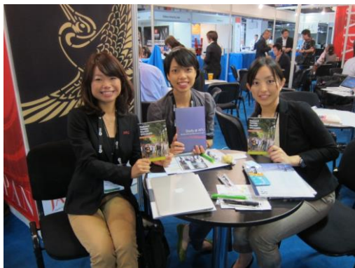
姊妹校日本亞洲太平洋立命館大學代表