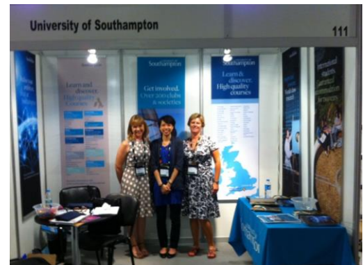
英國南安普敦大學代表