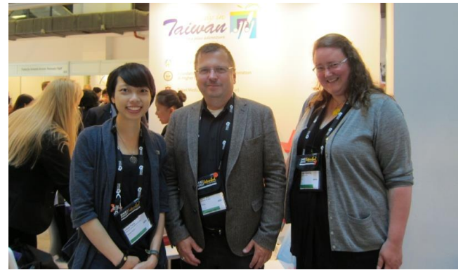
姊妹校奧斯陸大學代表