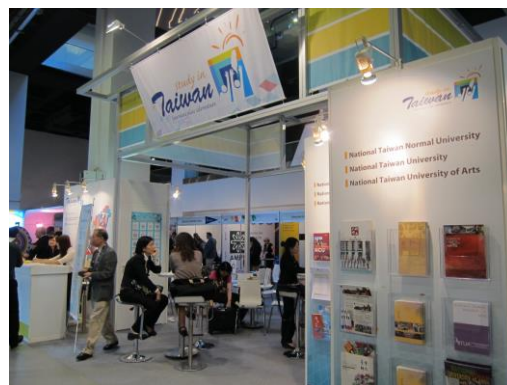
台灣攤位與文宣牆