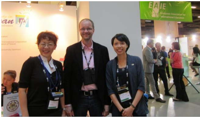
姊妹校芬蘭奧盧大學代表