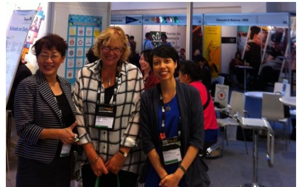
英國羅浮堡大學代表