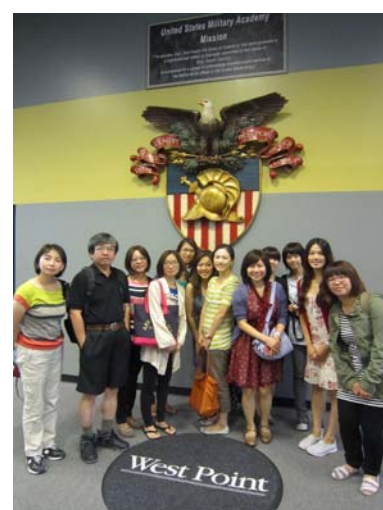
文化參訪-美軍西點軍校