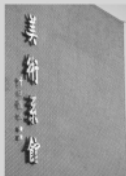
藝術學院 Fine Arts