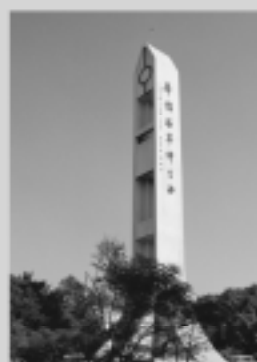
國際與僑教學院 International Studies and Overseas Chinese Education