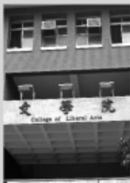
文學院 Liberal Arts