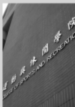
運動與休閒學院 Sports and Recreation