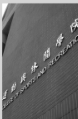
運動與休閒學院 Sports and Recreation