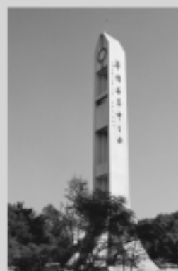
國際與僑教學院 International Studies and Overseas Chinese Education