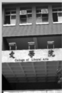
文學院 Liberal Arts