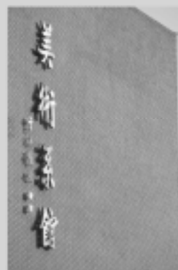
藝術學院 Fine Arts