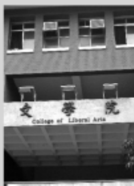
文學院 Liberal Arts