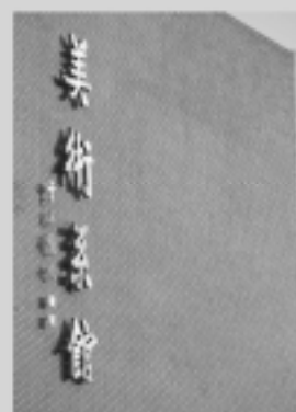
藝術學院 Fine Arts