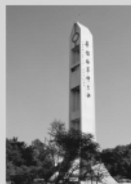
國際與僑教學院 International Studies and Overseas Chinese Education