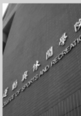
運動與休閒學院 Sports and Recreation